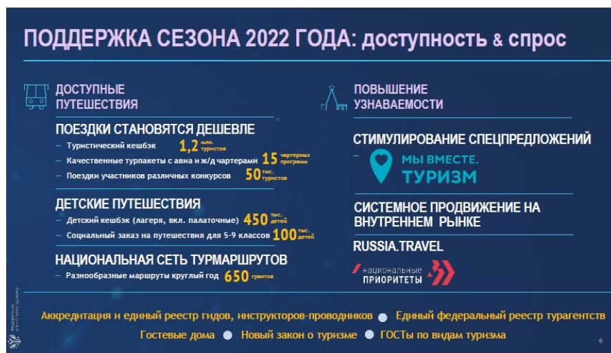
Рис. 3. Оценка Ростуризом сезона 2022

Важная роль отводится Ростуризмом увеличению мест проживания туристов, особенно классифицированным номерам. Их количество снижалось в пандемийные годы, но в 2022 году должно увеличиться и превзойти показатель 2019 года на 2,6%. См. Рис. 4.