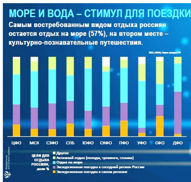
Рис 1. Какие туристические поездки выбирают россияне (презентация Зарины Догужовой, Ростуризм)

На втором месте идет культурно-познавательный туризм, на третьем – активный отдых (сплавы, походы, трекинги).