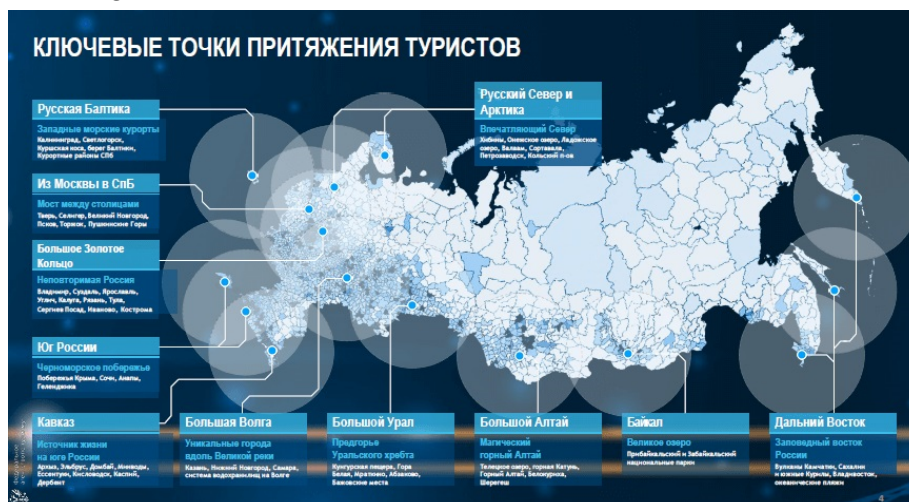
Рис. 5. Ключевые точки притяжения туристов

Ключевые точки притяжения туристов в России Зарина Догузова представила на карте – см. Рис. 5