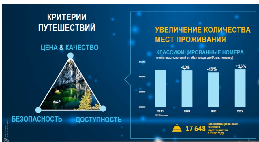
Рис. 4. Количество КСР в России (данные Ростуризма)

Важная роль отводится Ростуризмом увеличению мест проживания туристов, особенно классифицированным номерам. Их количество снижалось в пандемийные годы, но в 2022 году должно увеличиться и превзойти показатель 2019 года на 2,6%. См. Рис. 4.